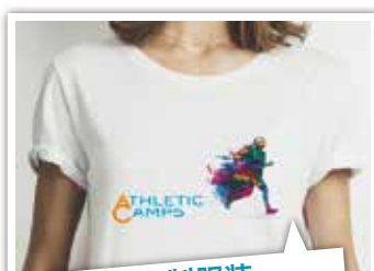
定制服装 (热转印材料)